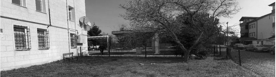
Şekil 11: K11 kursuna ait bahçe alanı

Zemininde toprak ve çim alan bulunan ve etrafı çitler ile çevrilmiş kursta herhangi bir park oyuncak ya da denge oyuncakları bulunmamaktadır. Dar alanda olması sebebiyle bitki ve hayvan bakım alanları da mevcut değildir. Tüm bu şartlar doğrultusunda yine de açık havada sosyalleşmek isteyen çocukların ihtiyaçları bu bahçe alanı sayesinde karşılanmaktadır.