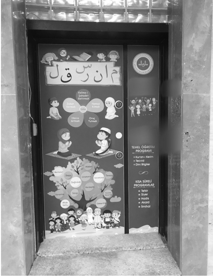
Şekil 3: K17 kursuna ait giriş alanı

Kısmen yeterli olmayan kurslara bakıldığında bazı kurslarda bina önü yeterli genişliğe sahip olmadığı için öğrencilerin giriş ve çıkış saatinde kalabalık oluşturduğu tespit edilmiştir. Güvenlik açısından çocuğun habersizce dışarı çıkmaması ya da kursa içerisine öğreticinin bilgisi dahilinde olmayan yabancı insanların girmemesi için ders saatleri içerisinde dış kapı kilitlenmektedir. Edinilen bilgiye göre kapının kilitlenmesi gözden kaçırılan bir kursta (K9) öğrencinin ders saatleri içerisinde personel ve öğreticinin bilgisi dahilinde olmadan dışarıya çıkmaya çalıştığı tarafımıza aktarılmıştır.