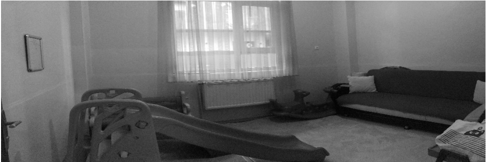
Şekil 9: K16 kursun ait oyun alanı

Tüm bu yeterli bulunan hususların dışında DİB uygulama esaslarına göre kısmen yeterli bulunan kurslar da karşımıza çıkmaktadır. Yeterlilikleri tam olarak karşılayamayan kursların; oyun alanının yeterli genişliğe sahip olmaması, oyun odasının içerisinde yumuşak zeminli malzeme kullanılmaması, materyal bakımından eksik yetersiz olması, oyun alanının kendisine ait özel bir alanda değil de sınıf ya da giriş alanında bulunması gibi yetersizlikleri gözlemlenmiştir. Tüm bu gözlemlere dayanarak kurslar içerisinden örnek vermek gerekirse: “Sınıfta genel olarak oyuncaklar dağınık bir vaziyette bulunuyor. Oyun alanı olarak kullanılan oda çok küçük ancak 4 öğrenci sığabilir. Oyun odasının içerisinde kaydırak, tahterevali ve bir de koltuk var. Başka bir materyali koymak için yeterli alan yok. Yerde kaydırmaz halı kullanılmış, yumuşak mat yoktu. Oyun odası içerisinde bulunan peteğin etrafında herhangi bir koruma bulunmamaktadır.” (K16)