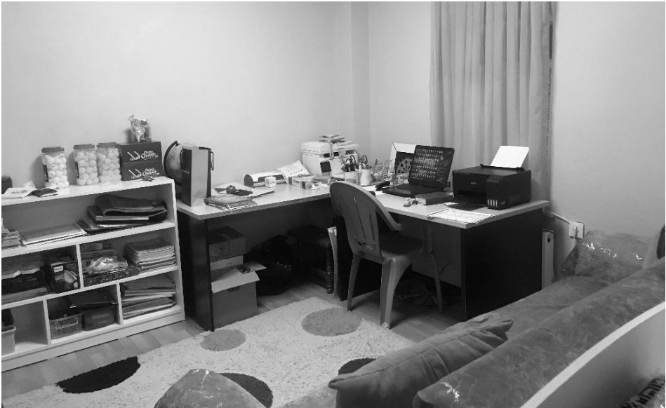
Şekil 7: K15 kursuna ait idare alanı

Alan yetersizliğinden dolayı bazı kurslarda oyun odasının sınıf içerisinde bulunması (K14, K15, K16) diğer bir kursta ise idarenin sınıf içerisinde bulunması (K15) gibi problemlerle karşılaşılabilir. İdarenin sınıf içerisinde bulunması ile ilgili görsel Şekil 7 ile gösterilmektedir: