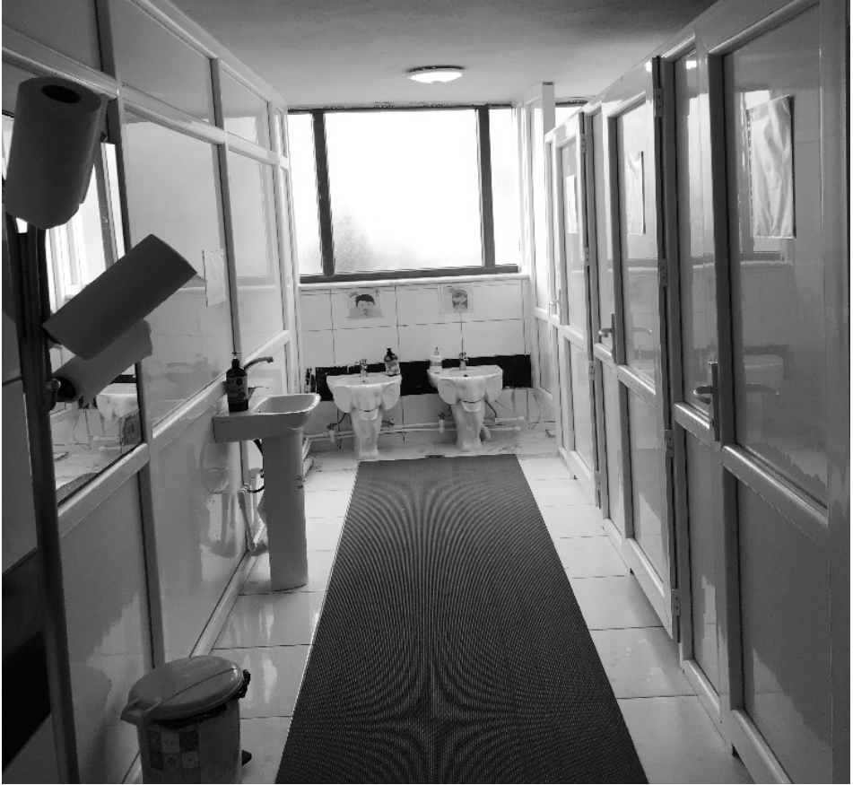
Şekil 13: K7 kursu lavabo ve tuvalet alanı

öğrenci tuvaletinin aynı yerde bulunması, kız ve erkek öğrencilerin aynı lavabo ve tuvaleti kullanması, zeminden kaynaklı rutubet problemi ve ısınma problemi. Bu kurslardan bir tanesine örnek vermek gerekirse K7 kursu öne çıkmaktadır. Gözlemler sırasında alınan notlar neticesinde: Kurs camii altında bulunduğu için tuvalet alanında rutubet ve böcek problemleri yaşanmaktadır. Ayrıca kursun içerisindeki tuvaletin daha önceleri şadırvan olarak kullanıldığı kurs açıldıktan sonra ise DİB uygulama esaslarına uyum sağlayabilmesi için dönüştürüldüğü bilgisi de alınmıştır. Kursta toplam 56 öğrenci eğitim görürken tuvalet alanında yalnızca 1 kız 1 erkek lavabo ve klozet bulunmaktadır. Personel tuvaleti de öğrenci tuvalet alanında bulunmaktadır. Ders esnasında ya da oyun saatinde ihtiyaçlarını karşılamak isteyen öğrencilerin sığara girdiklerinin, bazen ise yaşlarından kaynaklı olarak sıra beklerken tuvaletlerini kaçırdıkları da teyit edilmiştir. (Bk. Şekil 13).