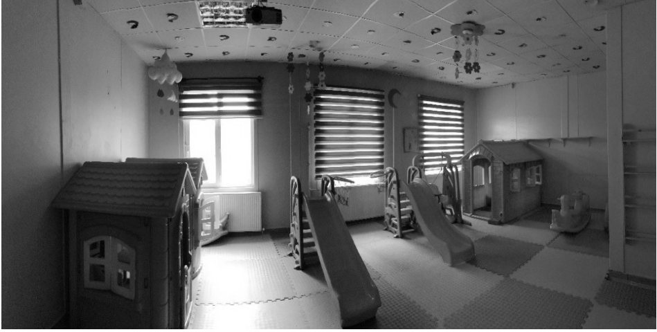
Şekil 8: K5 kursuna ait oyun alanı

Tüm bu yeterli bulunan hususların dışında DİB uygulama esaslarına göre kısmen yeterli bulunan kurslar da karşımıza çıkmaktadır. Yeterlilikleri tam olarak karşılayamayan kursların; oyun alanının yeterli genişliğe sahip olmaması, oyun odasının içerisinde yumuşak zeminli malzeme kullanılmaması, materyal bakımından eksik yetersiz olması, oyun alanının kendisine ait özel bir alanda değil de sınıf ya da giriş alanında bulunması gibi yetersizlikleri gözlemlenmiştir. Tüm bu gözlemlere dayanarak kurslar içerisinden örnek vermek gerekirse: “Sınıfta genel olarak oyuncaklar dağınık bir vaziyette bulunuyor. Oyun alanı olarak kullanılan oda çok küçük ancak 4 öğrenci sığabilir. Oyun odasının içerisinde kaydırak, tahterevali ve bir de koltuk var. Başka bir materyali koymak için yeterli alan yok. Yerde kaydırmaz halı kullanılmış, yumuşak mat yoktu. Oyun odası içerisinde bulunan peteğin etrafında herhangi bir koruma bulunmamaktadır.” (K16)