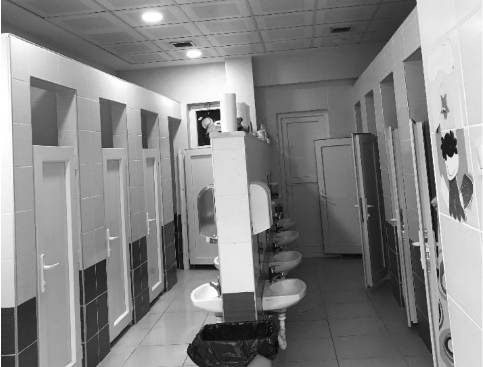
Şekil 12: K2 kursuna ait lavabo ve tuvalet alanı

DİB uygulama esasları içerisindeki şartları büyük oranda taşıyan 3 kurs dik-kate alındığında; tuvalet sayılarının her 12 çocuğa 1 lavabo ve klozet kullanım imkânı verecek şekilde düzenlenmesi, personel tuvaletinin ayrı bir alanda bulunması, kız ve erkek tuvaletlerinin bir duvar ile ortadan ikiye ayrılması, lavabo, klozet ve tuvalet kabinlerinin uygulama esaslarına uygun olarak hazırlanması öne çıkmaktadır. Gözlemlenen ve yeterlilik hususunda tam not alan kurslardan bir örnek vermek gerekirse K2 kursu öne çıkmaktadır. Kurs içerisinde toplam 6 sınıf olmakla beraber her sınıfta en az 12 en fazla 15 öğrenci eğitim görmektedir. Sınıf alanlarına yakın bulunan tuvalet alanı içerisinde 4 kız 4 erkek olacak şekilde toplam 8 lavabo ve tuvalet bulunmaktadır. Cinsiyetlere göre orta kısımdan bir duvar ile ayrılmıştır. Personele ait tuvalet ayrı bir alanda bulunmaktadır. Yerlerde kaydırmaz ve kolay temizlenebilir plastik bir malzeme kullanılmıştır. Verilen örneği desteklemek amacıyla aşağıda K2 kursuna ait resim sunulmaktadır.