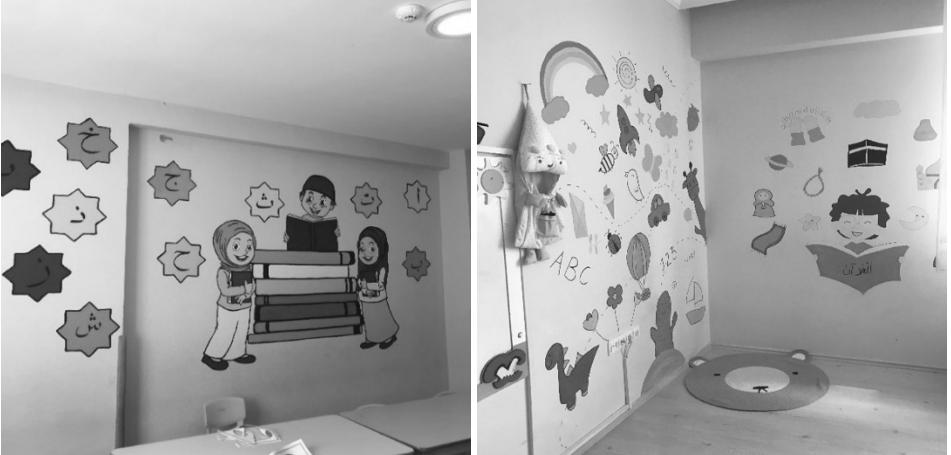
Şekil 5: K3 kursuna ait duvar alanı Şekil 6: K20 kursuna ait duvar alanı

Uygulama esasları konusunda yeterliliği bulunan diğer kurslara bakacak olursak sınıfın içerisinde farklı etkinlik alanlarının oluşturulması (K5, K16, K20), bina içerisinde daha ferah renkler kullanılması ve farklı görseller ile duvar süslemelerinin yapılması (K2, K3, K5, K15, K20) sınıf zemininde kaydırmaz ve kolay temizlenebilir parke ve yumuşak malzemeli yer döşemesi kullanılması gibi ayırt edici unsurlar da karşımıza çıkmaktadır. Sınıf içerisindeki duvarları farklı görseller ile boyayarak süslenen sınıflara örnek vermek gerekse Şekil 5 ve Şekil 6 ile bunlar gösterilebilir: