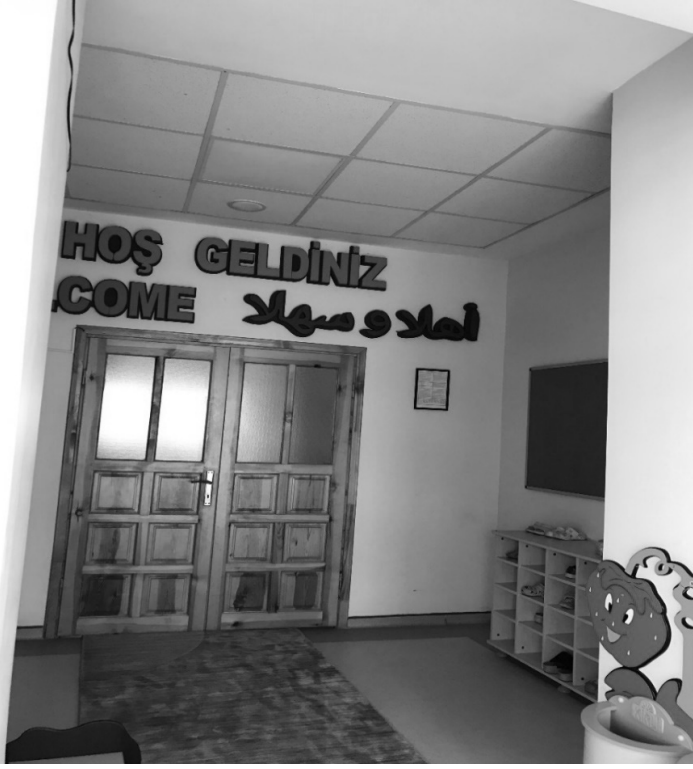
Şekil 2: K2 kursuna ait bina giriş ve çıkış alanı

Gözlemlenen ve kısmen yeterli olmadığına kanaat getirilen diğer 9 kursta ise hem veli bekleme alanları olmaması sebebiyle giriş ve çıkış saatlerinde bina önünde kalabalık oluşması hem de yeterli güvenlik önlemleri alınmaması sebebiyle çocukların bazen tehlikeye girebildiği görülmektedir. Ziyaret edilen bazı kurslardan edinilen bilgilere binaen daha önceden bir kurstan çocukların habersizce çıktıkları (K1) bir diğer kursta ise ailesi tarafından kursa teslim edilen çocuğun bina önünden ayrılarak kısa süreli bir kaybolma tehlikesi yaşadığı (K17) öğrenildi. Gözlemlerimiz neticesinde DİB uygulama esaslarına uyum sağlamadığı tespit edilen K17 kursu ile ilgili şu notlar alınmıştır: