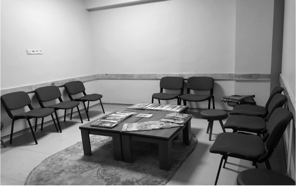
Şekil 1: K2 kursuna ait veli bekleme alanı

Kursun veli bekleme salonu Şekil 1’de görülmektedir.