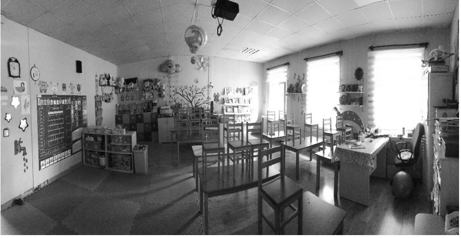
Şekil 4: K5 kursuna ait sınıf alanı

Uygulama esasları konusunda yeterliliği bulunan diğer kurslara bakacak olursak sınıfın içerisinde farklı etkinlik alanlarının oluşturulması (K5, K16, K20), bina içerisinde daha ferah renkler kullanılması ve farklı görseller ile duvar süslemelerinin yapılması (K2, K3, K5, K15, K20) sınıf zemininde kaydırmaz ve kolay temizlenebilir parke ve yumuşak malzemeli yer döşemesi kullanılması gibi ayırt edici unsurlar da karşımıza çıkmaktadır. Sınıf içerisindeki duvarları farklı görseller ile boyayarak süslenen sınıflara örnek vermek gerekse Şekil 5 ve Şekil 6 ile bunlar gösterilebilir: