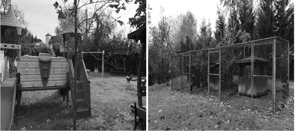
Şekil 10: K2 kursuna ait park ve hayvan bakım alanı

Kısmen yeterli bulunan bazı kurslardan elde edilen bilgiler doğrultusunda bu kursların bahçe alanının genişlik açısından dar yapıda bulunması, materyal açısından yetersiz olması, hayvan ve bitki bakım alanlarının olmaması, zemininde toprak ve çim bulunmaması, herhangi bir düşme durumunda çocuklar için tehlike oluşturmayacak yumuşak özellikte olmaması gibi unsurlar öne çıkmaktadır. Tüm bu eksikliklerle beraber şartları doğrultusunda bahçe alanını çit ve duvarlar ile çevirerek güvenli alan oluşturan, zemininde çim ve toprak alanı bulunan ve yeterli sayıda olmasa da park oyuncakları bulunan kurslar da vardır. Örneğin K11 kursundan elde edilen bilgiler doğrultusunda şu yorum yapılabilir: